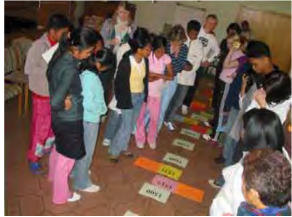
ENSA-Vorbereitungsseminar, Zeitleiste Geschichte