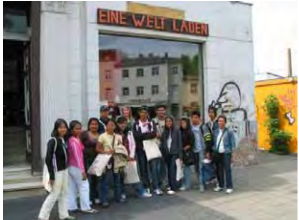
Besuch des Eine-Welt-Ladens in Cottbus