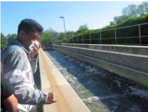
Exkursion in das zentrale Klärwerk von Burg