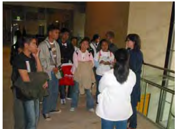
Führung durch den Berliner Reichstag