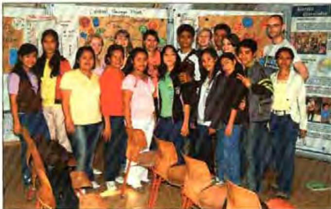
Die Burger Schüler mit ihren philippinischen Gästen.