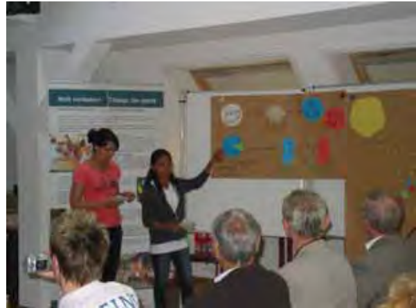
Projektabschlusspräsentation in der Schule