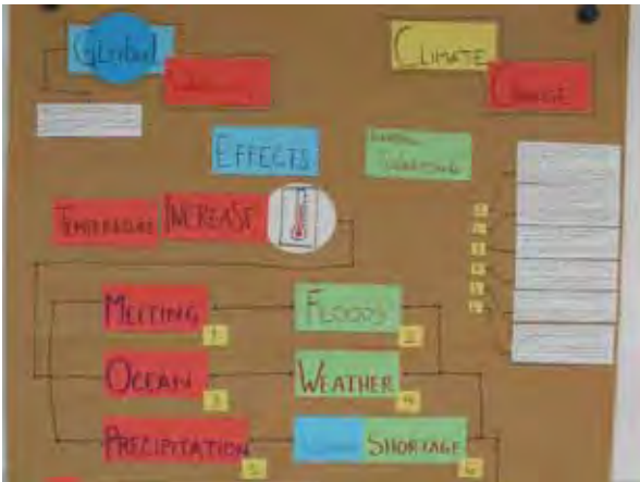
Schülerposter zum Klimawandel