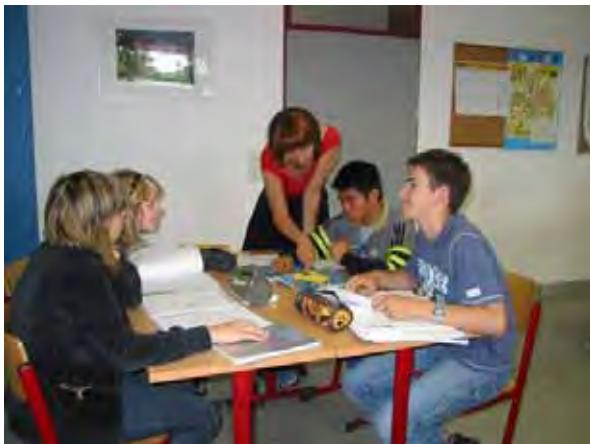
Gemeinsamer Unterricht an der Gesamtschule Burg