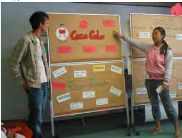
Präsentation der Gruppenarbeit „Coca Cola“