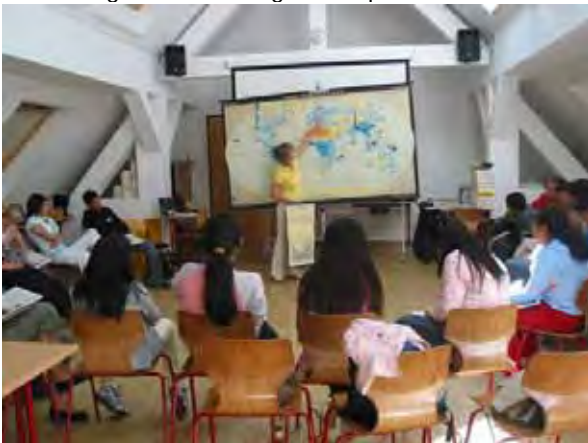
Wasserworkshop, Wasserverteilung auf der Erde