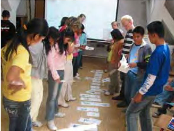
Workshop zum virtuellen Wasser