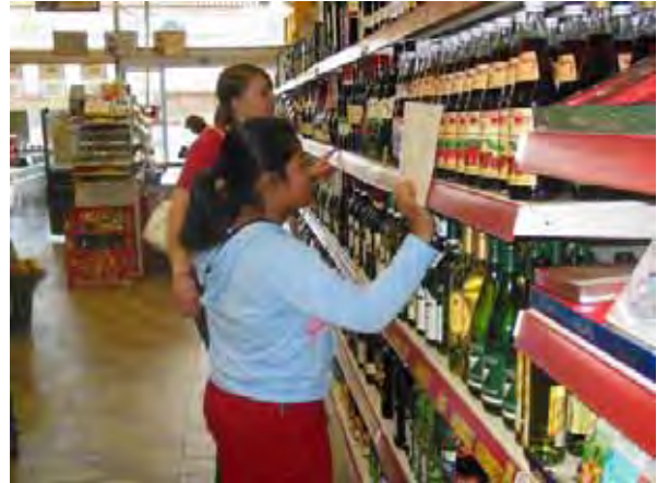
„Wasserdetektive“ im Supermarkt