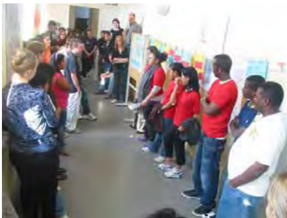
Präsentation in der Springschool, Werftpfuhl