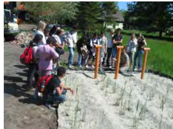
Besichtigung einer Pflanzenkläranlage in Burg