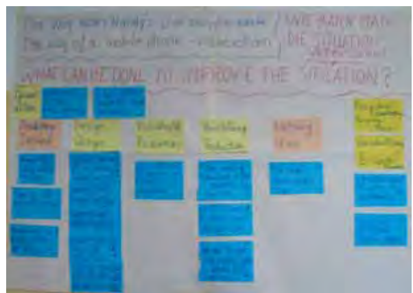
Ergebnisposter der Workshopgruppe „Handy“