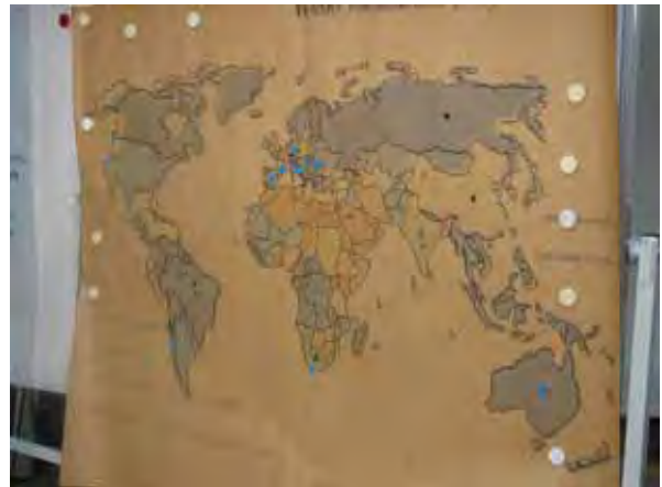
Produkte aus wasserarmen und wasserreichen Ländern