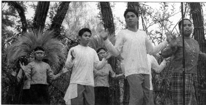
Die philippinischen Gastschüler zeigten mit einem Programm in der Weidenburg ihre Traditionen

Annett Kaufmann, Lehrerin der Gesamtschule Burg