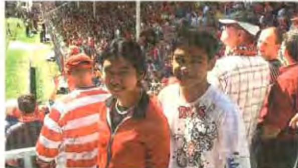
Die philippinischen Schüler erfahren Fußball hautnah.

Spre-Neiße Kreises Dieter Frieße konnten die Schüler aktuelle Fragen zu den Themen Umwelt und Ökologie klären. Als Gastgeschenk lud dieser die Schüler dann zum Fußballspiel des FC Energie Cottbus gegen den HSV ein. Hier erlebten die Filipinos zum ersten Mal die mitreißende Stimmung eines ausverkauften Fußballstadions und feierten den FCE lautstark an. Zum Abschluss feierten die deutschen und philippinischen Schüler vergangenen Freitag im Weidenrom in Burg einen kulturellen Abend mit traditionellen Tänzen und Liedern. Stefanie Kusche