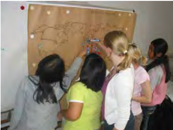
Auswertung der Supermarkt-Exkursion