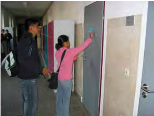
Tagalog-Vokabeln werden in der Schule verteilt