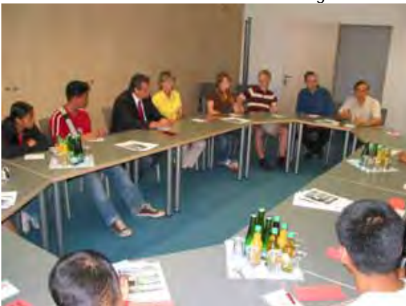
Diskussionsrunde mit dem Landrat Dieter Frieze