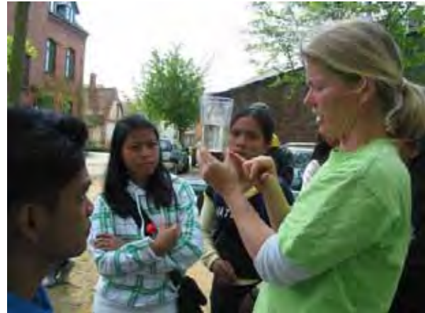
Auswertung der gefundenen Wasserlebewesen im Glas