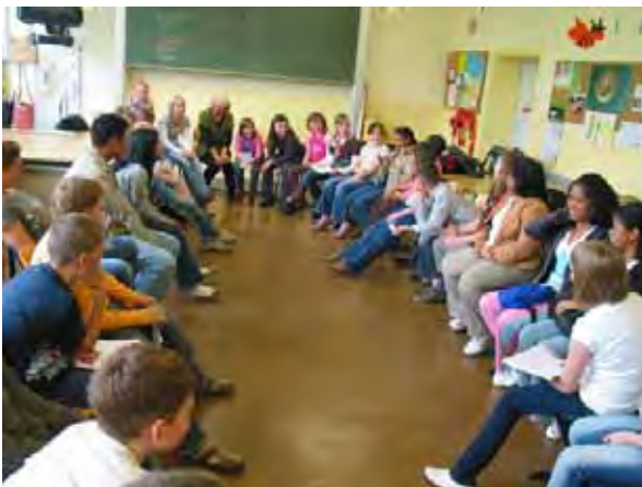
Projektunterricht in der Grundschule Burg