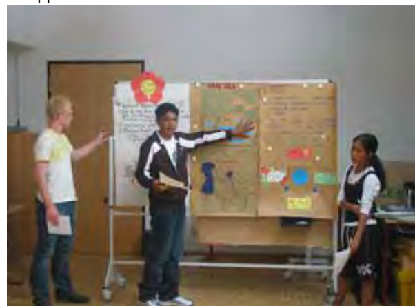
Präsentation der Gruppenarbeit „Baumwolle“