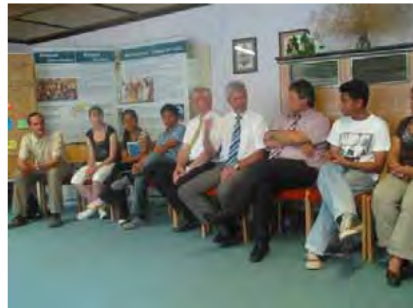
Besuch des Bildungsministers Holger Rupprecht