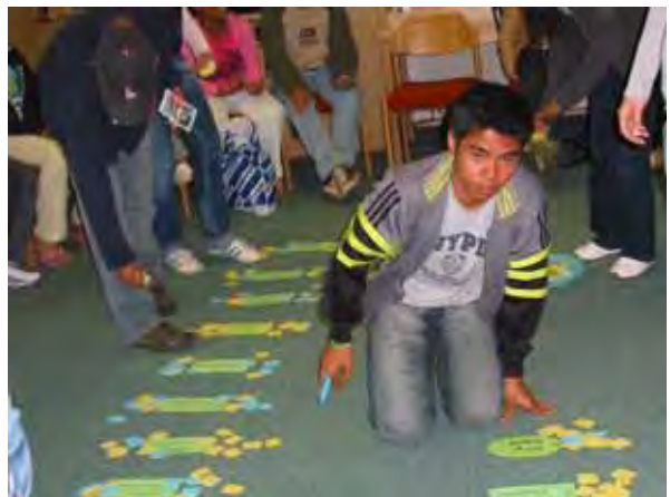
Auswertung des Projektes