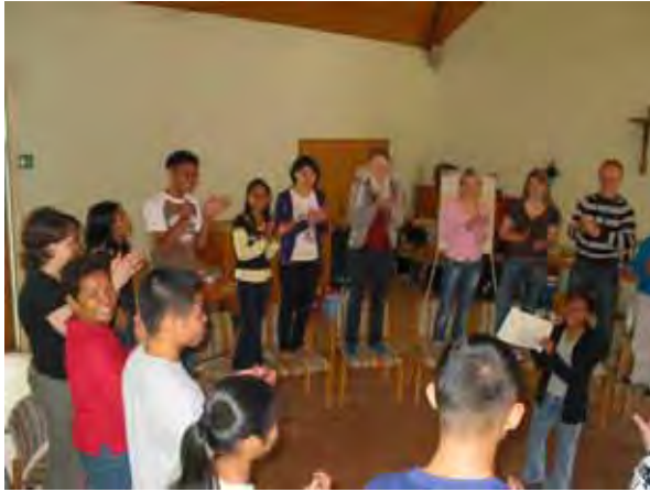
ENSA-Vorbereitungsseminar in Neuhausen