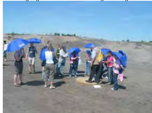
Exkursion in den Tagebau Meuro