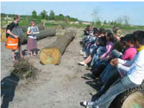
Besichtigung des verschwundenen Dorfes Lakoma