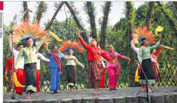
Rejowanski program Filipinarjow jo zagóril pógiedarje pšez te drastwy a pšez rejowarske zamóžności góšći z eksotiskego kraja.