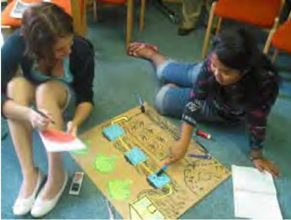
Vorbereitung der Abschlusspräsentation