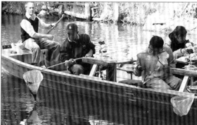
Auf dem Forscherkahn „Nautilust“ in Lübbenau erforschten die Gastschüler mit Interesse Biologie, Chemie und Physik des Spreewassers.

Das entwicklungspolitische Schulaustauschprogramm ENSA fördert den Schüleraustausch zwischen Deutschland und Entwicklungs- beziehungsweise Transformationsländern. Das sind die ehemaligen Länder in Mittel- und Osteuropa sowie Asien (China, Vietnam) sowie die Nachfolgestaaten der ehemaligen Sowjetunion, die sich im Übergang (Transformation) von der Zentralverwaltungswirtschaft in eine marktwirtschaftliche Wirtschaftsordnung befinden.