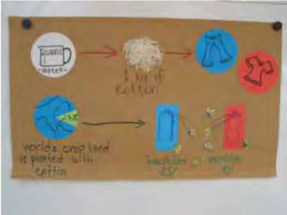
Schülerposter zur Baumwollproduktion