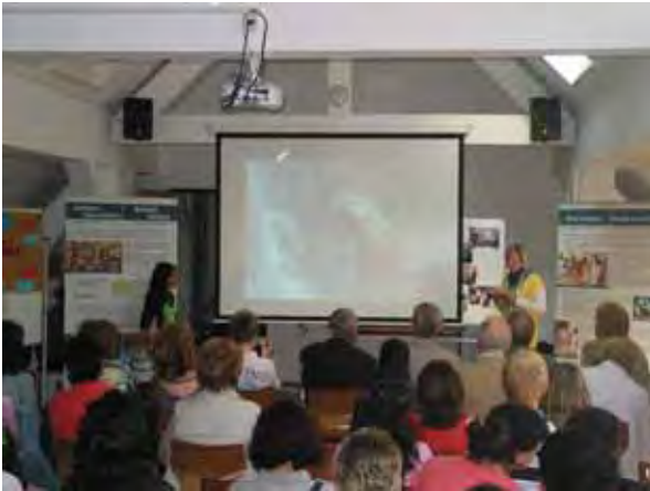
Projektabschlusspräsentation in der Schule