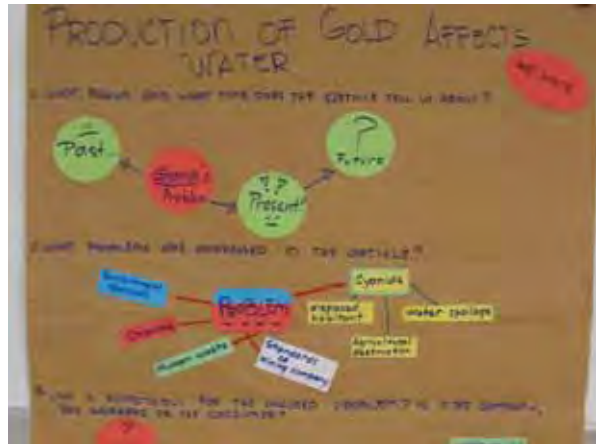
Schülerposter zur Goldproduktion