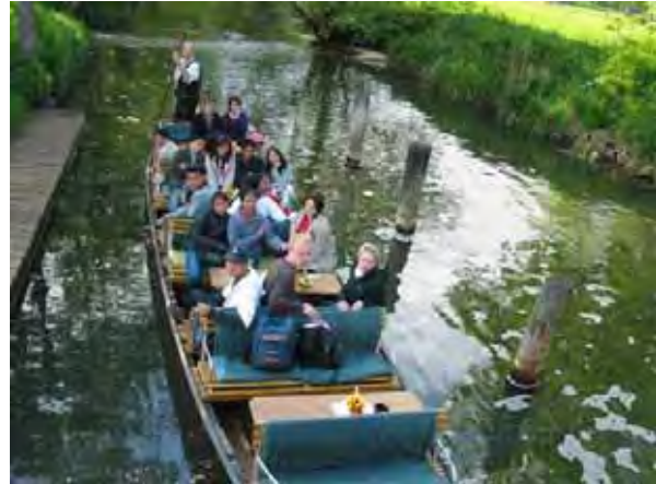
Exkursion per Kahn im Spreewald