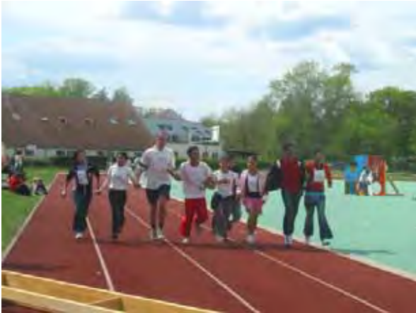
Spendenlauf in Fürstenwalde