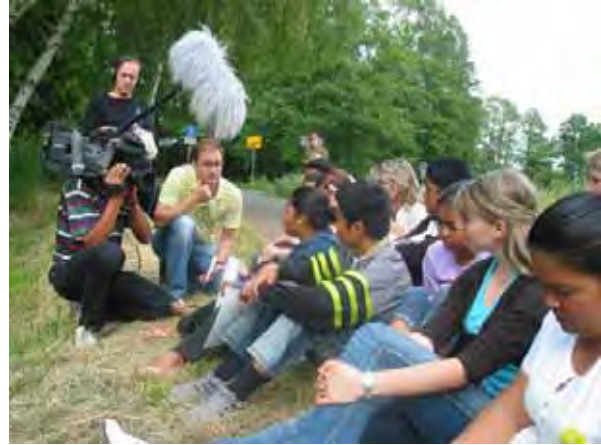
RBB-Filmteam berichtet über das Projekt