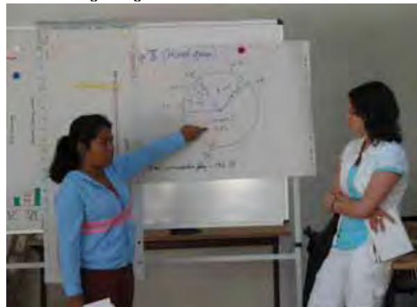
Unser persönlicher Wasserverbrauch im Haushalt