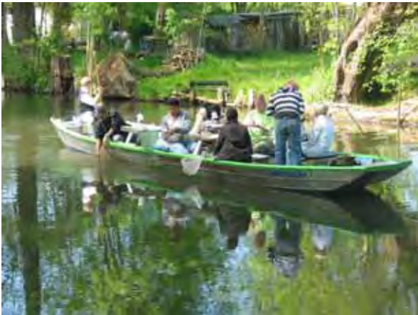
Gewässergütebestimmung im Biosphärenreservat